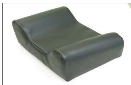
KH006 TV -Kopfkissen für Patientenauflagen mit Thermo-Visco-Füllung