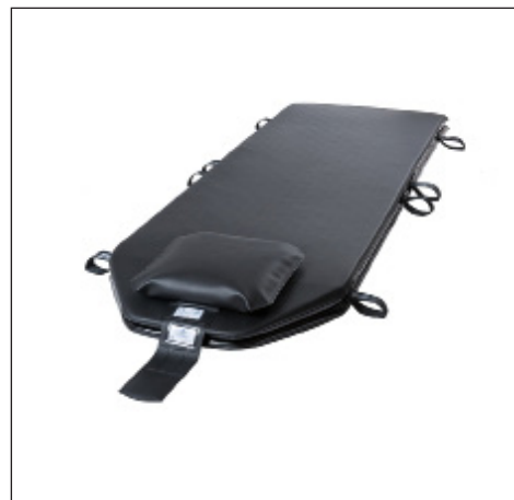
SCHNITZLER im Krankenhaus