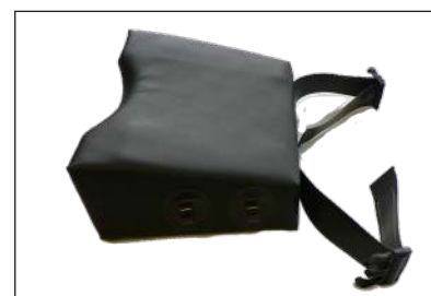
KH001 -OP-Anästhesiekopfkissen für OP-Vakuummatratzen, kurz