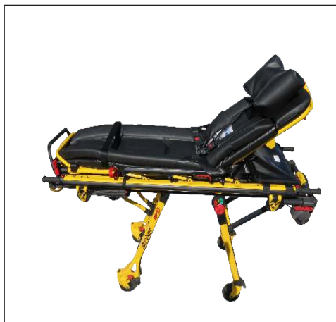
SCHNITZLER im Rettungsdienst

.....steht Ihnen das SCHNITZLER-Team gerne zur Verfügung!