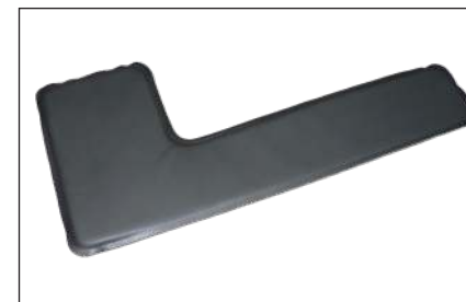
KH901 -Lagerungspolster, L-förmig