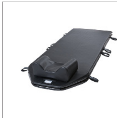
KHD190-64-8 mit Kissen KH006 TV