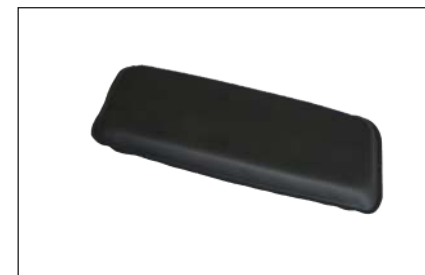
KH904 -Lagerungspolster, groß