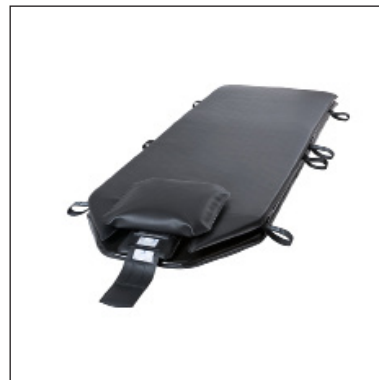
KHD190-64-8-CT mit Kissen KH008 K