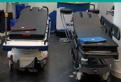
AUF ALLEN STRECHERN EINSETZBAR