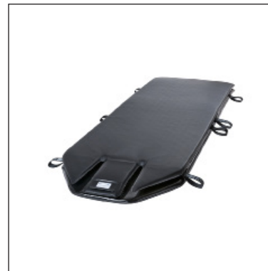
KHD190-64-8-CT ohne Kissen