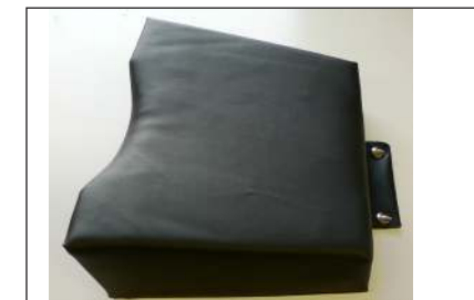
KH002 -OP-Anästhesiekopfkissen für OP-Vakuummatratzen, lang