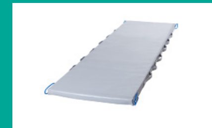
UMLAGERUNGS-AUFLAGEN FÜR X-RAY-STRETCHER