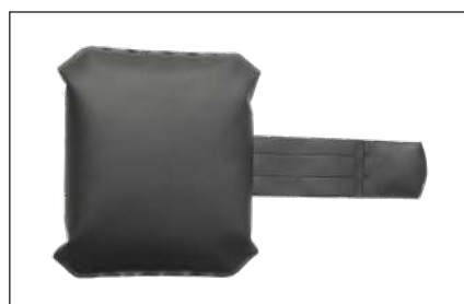
KH008 K -Kopfkissen für Patientenauflagen mit Granulatfüllung