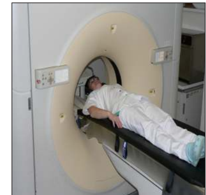
einsetzbar auf MRT-, CT- und Röntgen-Tischen