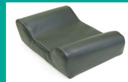
KOPFKISSEN MIT THERMO-VISCO-FÜLLUNG