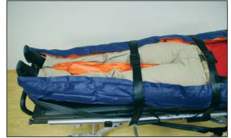
Bei Verwendung von Art. 814 K und 817 K Beinstabilisierung, wie dargestellt, unterstützend anmodellieren