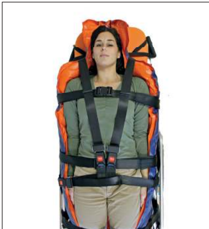
Patient auf Vakuummatratze zum Bestimmungsort tragen. Während der Beförderung muss der Patient mit einem Patientenrückhaltesystem gesichert werden. Patientenrückhaltesystem gem. der Bedienungsanweisung des Systemherstellers anlegen.