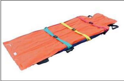
Vakuummatratze auslegen- Ventil und Fixiergurte öffnen