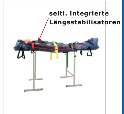
Durch seitlich, zusätzlich integrierte, Längsstabilisatoren bei den Varianten 813 K, 814 K, 816 K, 817 K und 818 K wird eine Stabilität auf Spineboard Niveau erzeugt.

Angeschweißte Griffe nicht in Richtung der Schweißflächen ziehen!