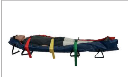
Patient auf Vakuummatratze auflegen, Fixiergurte schließen und Absauggerät an Ventil anschließen. Absaugung starten